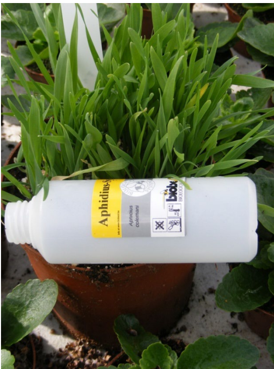
Banker-plant med Aphidius –snyltehvepse.