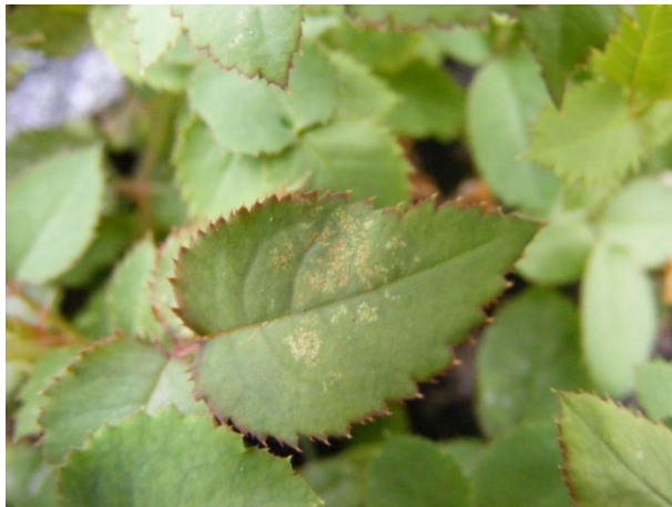
Begyndende angreb af væksthusspindemider på potteroser