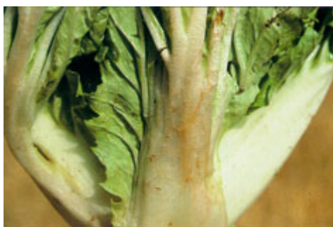
Angreb af bladribbesnudebillens larve i kinakål. Der dannes brunlige minegange i bladstilke og bladribber.