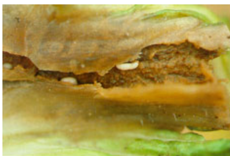
Bladribbesnudebillens larve i bladribbe på kinakål.