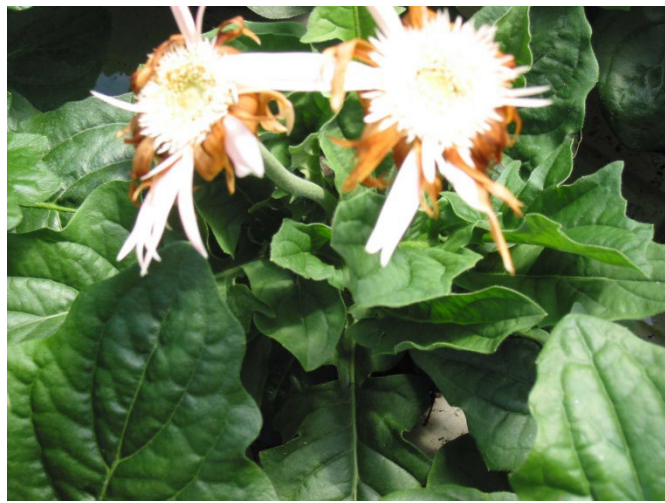
Gråskimmel i bunden af planten til venstre og i blomster på billedet til højre