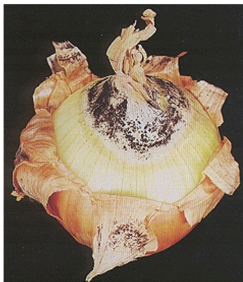
Angreb af sortskimmelsvampen Aspergillus på lagret løg (Foto: Lars Semb, Norge).